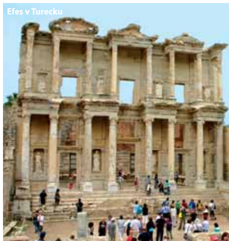
Efes v Turecku

čekat přistavený autobus, který Vás i s česky mluvícím delegátem během příštích patnácti minut odveze do areálu někdejšího antického města Efes. Uvidíte zde spoustu památek z dob před zhruba 2500 lety až po raný středověk. Po skončení prohlídky Vás čeká návštěva v nomádké vesnici, kde mimo jiné spatříte, jak se až do dnešních dnů ručně vyrábějí pravé turecké koberce. Poté se vrátíte zpět do přístavního města Kuşadası, kde můžete využít zbývající čas k nákupům, občerstvení, nebo třeba k prohlídce pevnosti u přístavu, v níž se nachází několik restaurací. Je odtud velmi atraktivní pohled na celý přístav i rychle rostoucí město. Návrat na Samos kolem 19. hodiny. Upozorňujeme, že turecká policie vybírá přístavní poplatek ve výši 10€ na osobu, který není zahrnutý v ceně výletu. Poplatek za zajištění transferu do přístavu na Samosu a zpět je cca 5€/osoba pro oblast Pythagorion, cca 9€/osoba pro oblast Votsalakia/Kampos a cca 10€/osoba pro oblast Possidonio. Nutný cestovní pas.